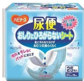
尿便おしりにひろがらないシート