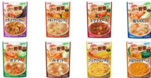
明治やわらか食ごろっと野菜

メニューは、みそ汁以外は、シチューや具たくさんスープなど、洋風メニューが多く、中には高齢者向けの昇進が少なかったカレーや、レトルト個食では珍しい塩ちゃんこなど、バラエティに富んでいる。高齢者は、必ずしもだしや醤油ベースの和風の献立だけでなく、シチューやポトフなど、具たくさんにすることでおかずと水分を同時に摂取でき、カロリーも摂取できるメニューが多いのが特徴。